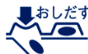
(PTPシートの取り出し図)