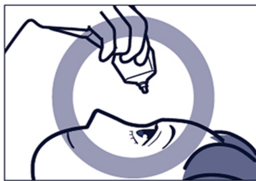
容器の先を下に向けて点眼